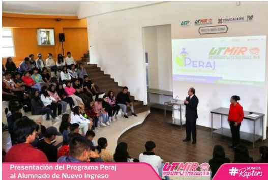
Presentación del Programa Peraj al Alumnado de Nuevo Ingreso